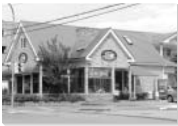
デライトコーヒー豆屋/長坂本店