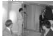
▲懇親会にて理事長の挨拶