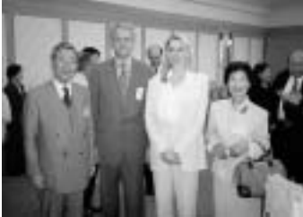
▲ホイネス駐日デンマーク大使夫妻と

(8) 新時代が求める国際的に通用する人材の育成は、もう我々教職員の手が届くところにあるようです。