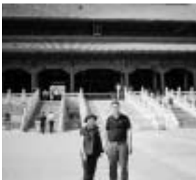
▲2002年5月 北京 故宮にて