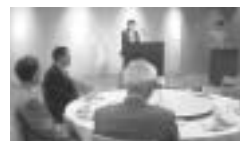
▲懇親会にて理事長の挨拶