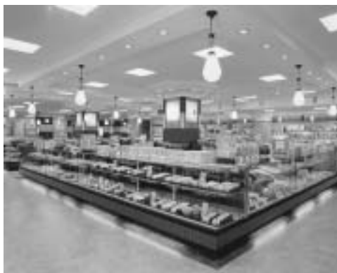
1F ショッピングフロア 和菓子・名産食品コーナー